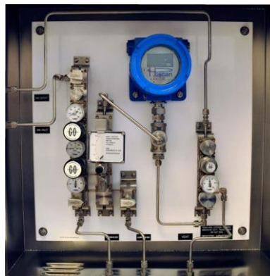
Рис. 3. Анализатор MOD- 2740 во взрывозащищенном корпусе, система пробоподготовки с интегрированным анализатором.

Датчики MOD- 2740 и газоанализаторы на их основе успешно применяются в процессах, где необходимо постоянно контролировать концентрацию водорода в системах АСУТП. К таким процессам относятся гидрокрекинг, гидроочистка, каталитический риформинг и изомеризация – основные процессы нефтепереработки, существующие в том или ином виде на всех НПЗ. Технологические потоки в этих процессах - в основном многокомпонентные, что затрудняет или делает невозможным применение простых датчиков, использующих измерение теплопроводности.